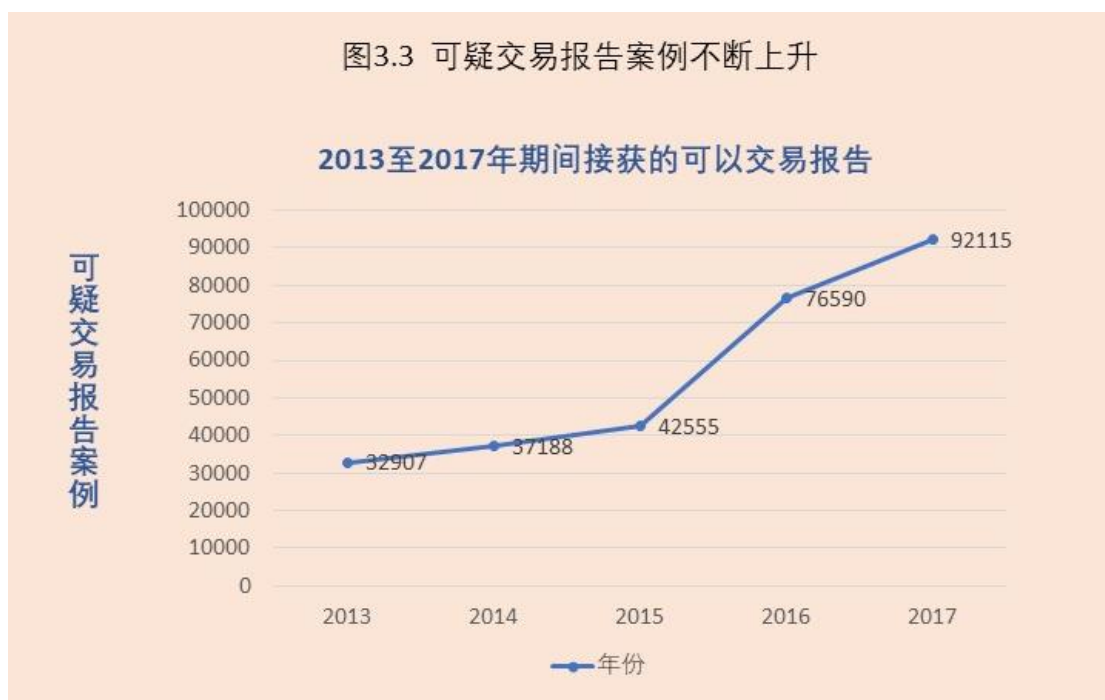
图3.3 可疑交易报告案例不断上升