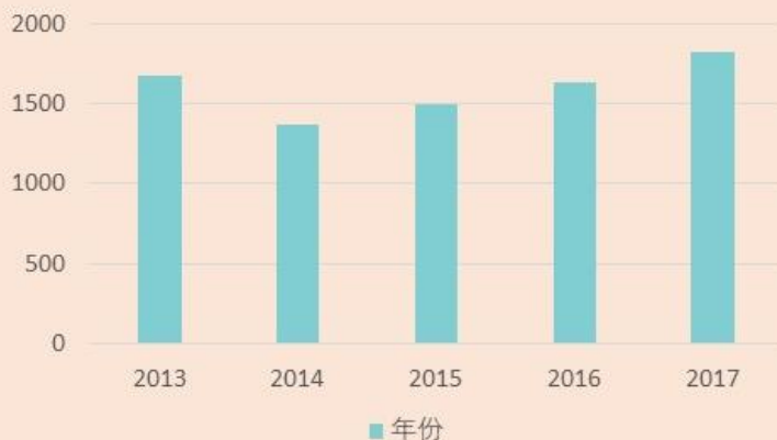
图3.2 2013至2017年的洗钱调查案件数目